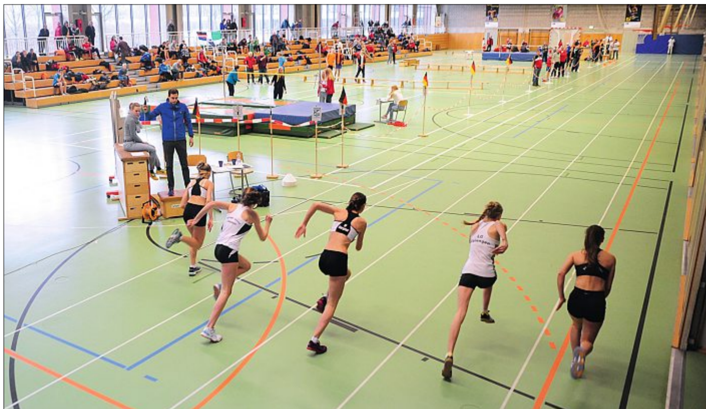
Traditionelle Titelvergabe in Emden. Die 33. Ostfrieslandmeisterschaften werden an einem Tag ausgetragen.

Die größten Teams stellen in diesem Jahr der SV War-