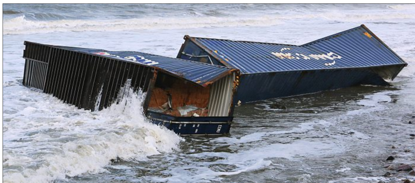
Zwei mit Holz beladene Schiffs-Container liegen am Strand von Wangerooge. Die angespülten Container vor den Ostfriesischen Inseln sollen bis Mitte Januar geborgen werden. Das sieht das Konzept eines Bergungsunternehmers vor, das jetzt den Behörden vorliegt.

bergen, wurden verworfen. Stattdessen sieht das Konzept nun eine Bergung von der Seeseite vor. Das Bergungsgerät und Equipment, so Linke, werde bereits zusammengestellt. Offen sei noch die Frage, von welchem Basishafen aus operiert und auf welcher der vier betroffenen Inseln begonnen werden solle. „Priorität hat der Schutz der Küstenschutzbauwerke auf den Inseln sowie der Schifffahrtswege“, betont der Sachbearbeiter (Seite 6).