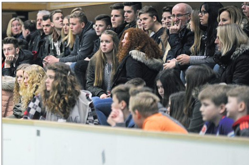
Gut besucht. Die Zuschauer erlebten beim Hager Supercup spannende Spiele. Am Freitag geht es mit der Trostrunde weiter. Das große Finale folgt am Sonnabend.